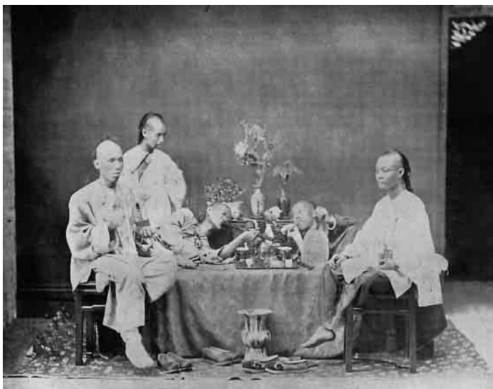
Fumaderos públicos en China imperial. ▀

Las citas están tomadas de John Newsinger, "Elgin en China", New Left Review , nº 15, julio-agosto de 2002.