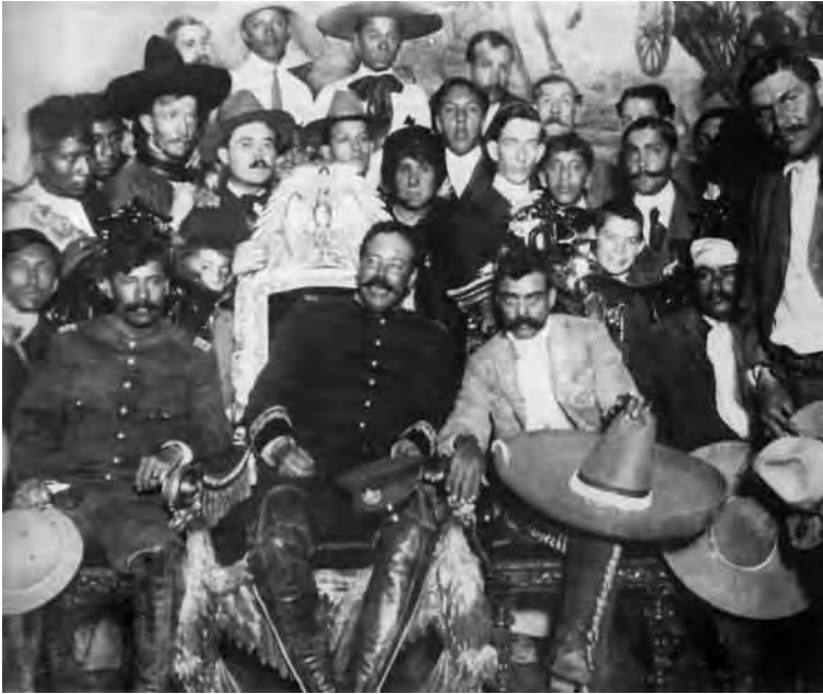
Pancho Villa, jefe de las fuerzas revolucionarias en el norte de México, sentado en el sillón presidencial, y Emiliano Zapata a su izquierda.

En Brasil, en 1899 hubo una revolución militar, el imperio cayó, se abolió la esclavitud y se proclamó la República. Aunque los sectores medios ganaron algún terreno, los avances de la ciudadanía fueron reducidos y la vida política quedó bajo el control de los sectores dominantes de los distintos estados, que establecieron acuerdos para gobernar. En el resto de los países, las oligarquías y los dictadores continuaron imponiendo su sello.